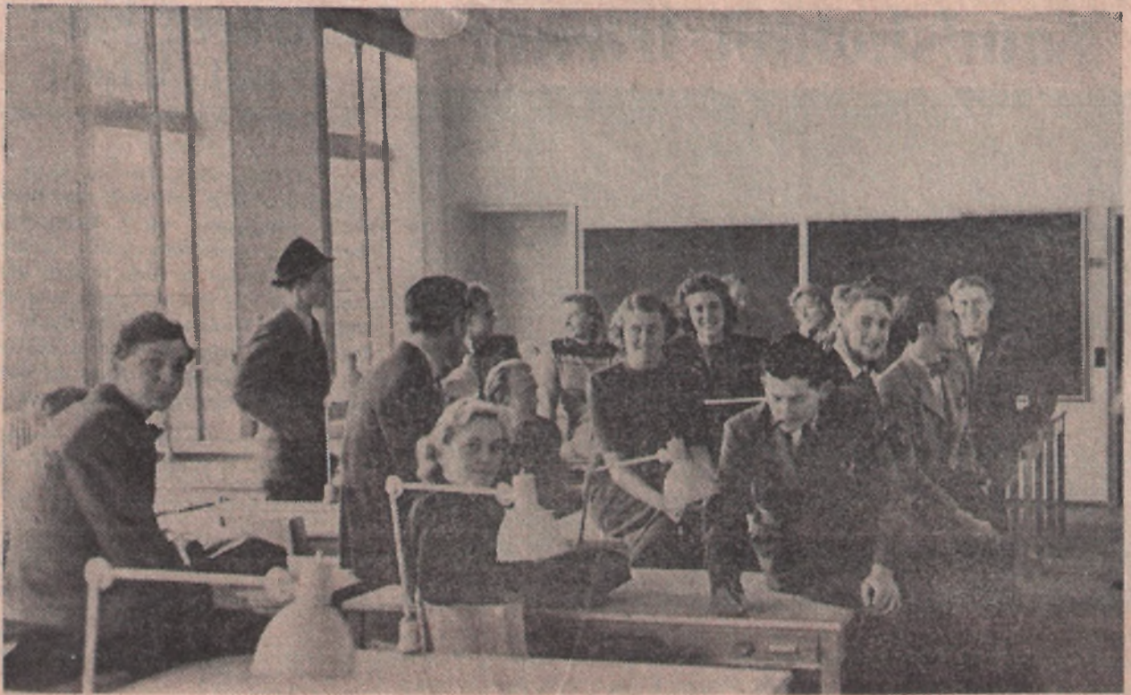
Et af de nye fine Undervisningslokaler.